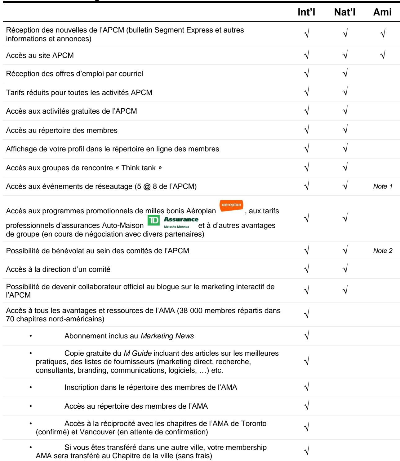
Tableau des avantages